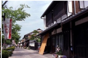
(キャッスルロード光景)